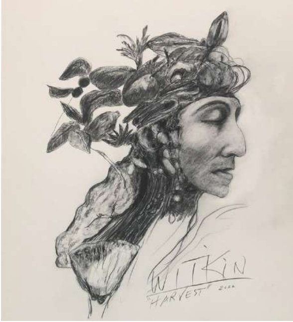
Joel-Peter WITKIN Harvest , 2022 Dessin au crayon graphite sur papier 45 x 33 cm, Pièce unique, Signé, titré et daté © Joel-Peter Witkin courtesy baudoin lebon