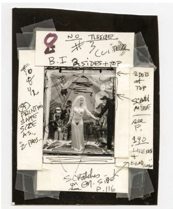
Joel-Peter WITKIN Marriage, Bogota , 2009 Planche contact, 25,4 x 20,3 cm, Pièce unique © Joel-Peter Witkin courtesy baudoin lebon