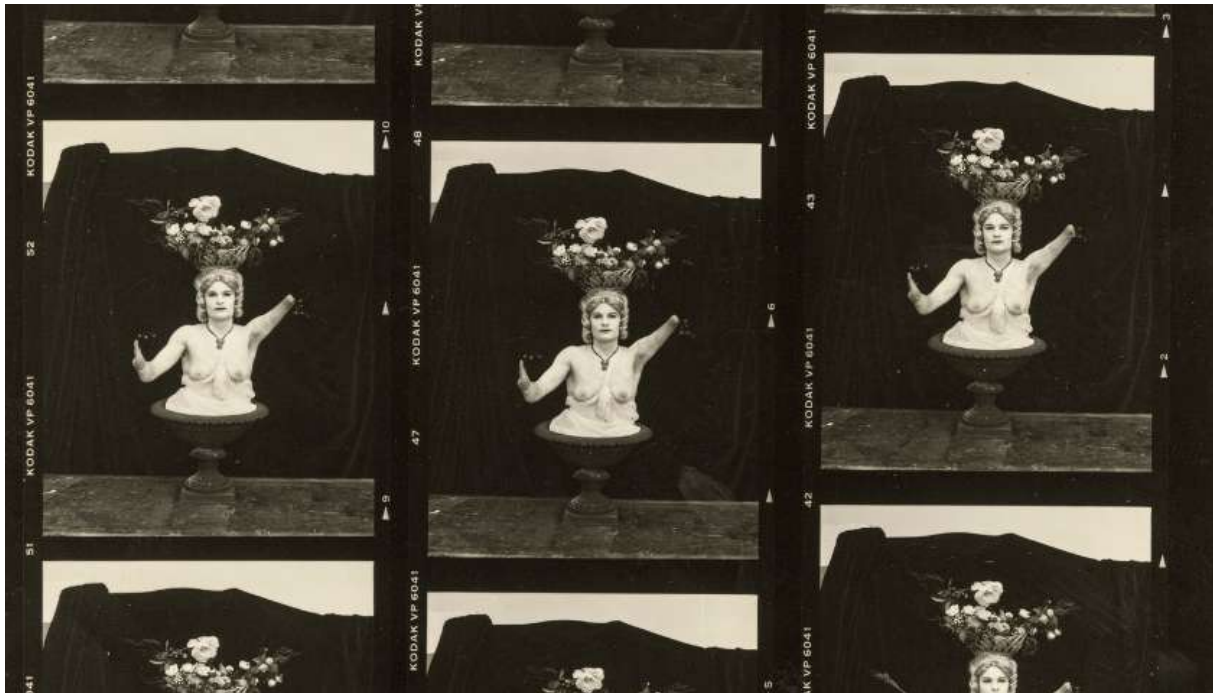
Joel-Peter Witkin, Abundance, Prague, 1997 , Planche contact