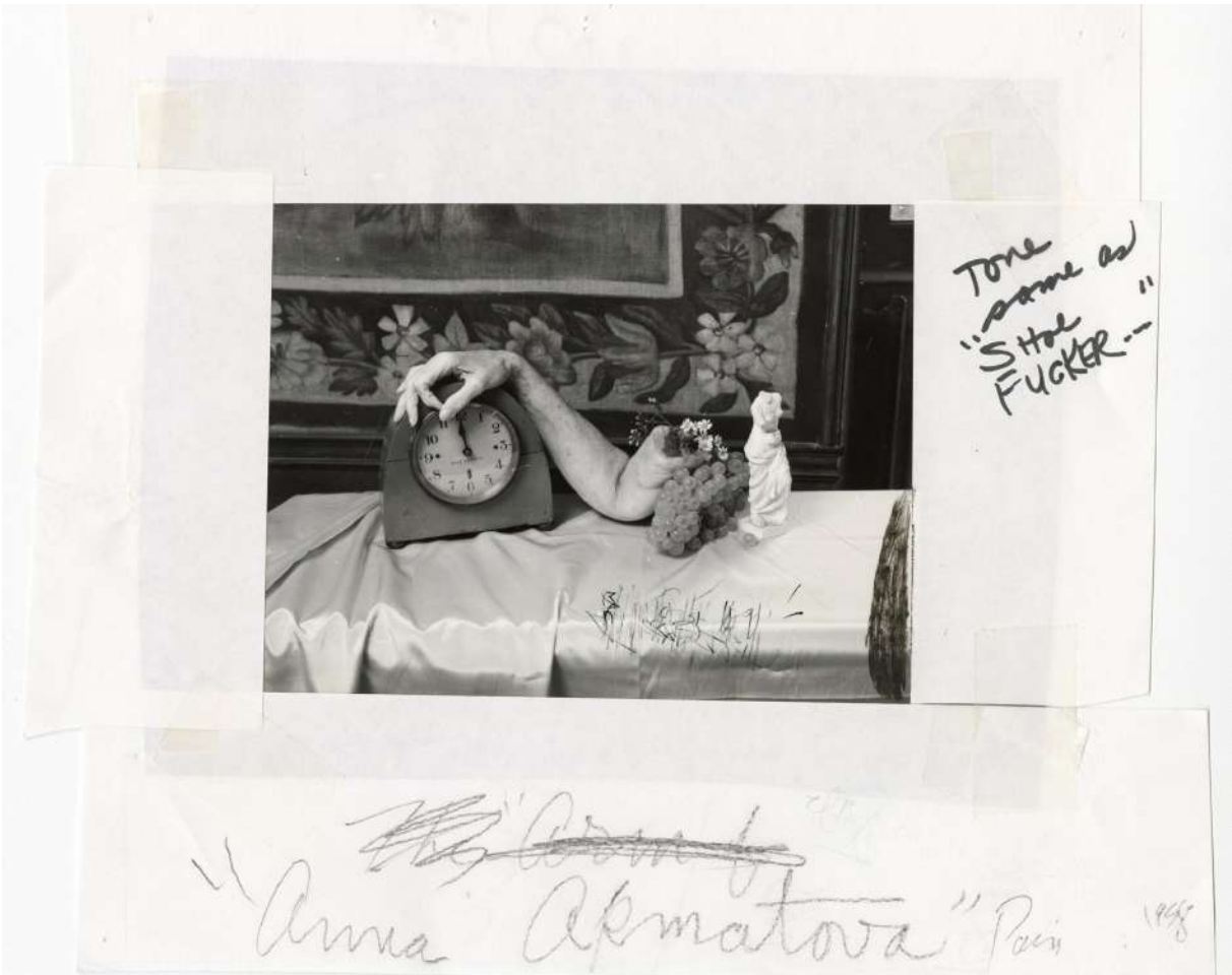
Joel-Peter WITKIN Anna Akhmatova, Paris, 1998 Dessin préparatoire au crayon graphite sur papier, Pièce unique, Signé, titré et daté