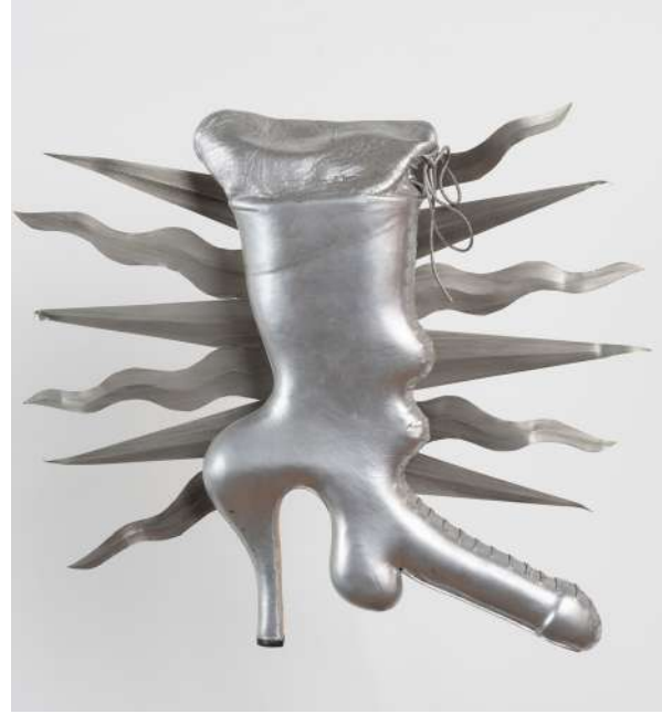
Joel-Peter WITKIN Botte en cuir , 2001 52 x 50 cm, Pièce unique