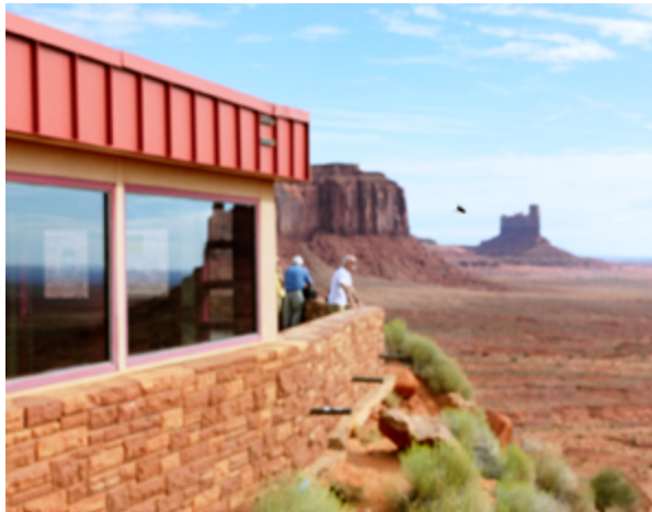
De bas en haut : Monument valley, 2022 et Flood, 2022 série Nothing new in the west, tirage pigmentaire, 45 x 36 cm

Le road-trip américain est un genre emblématique de l'histoire de la photographie. Il provoque un sentiment de liberté, d'évasion, de dépassement de soi et de possibilités infinies. Cependant les paysages américains incarnent également la relation conflictuelle entre humain et territoire, entre conquérant et conquis, créant ainsi un paysage en dissonance. En Israël, je faisais des allers retours sur une route s'étendant du nord au sud, couvrant 470 km que j'ai photographiés pendant de nombreuses années. Après mon déménagement à Londres, j'ai exploré régulièrement la campagne anglaise, cherchant à m'approprier ce nouveau territoire... C'est ainsi que ce projet de road-trip américain m'est apparu comme une suite logique. Mais, observer une culture étrangère en parcourant plus de 12 000 km en seulement 30 jours m'a demandé une approche plus dynamique pour mes prises de vue.