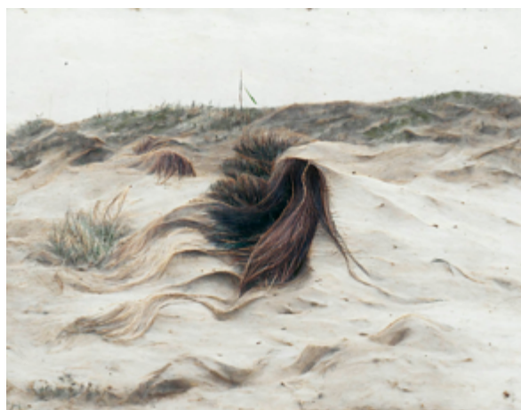
Tu dormais sur la plage avec un livre Plage livre , 2022, série I've forgotten this before , tirage pigmentaire, 29,7 x 42 cm

La série a été réalisée à l'aide d'outils d'intelligence artificielle.