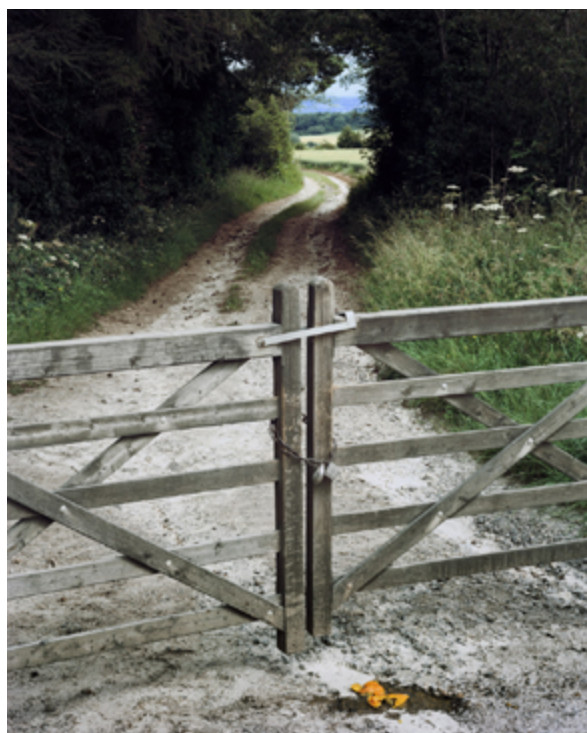
Walk to Paradise Garden, 2019, série English Encounters, tirage pigmentaire, 45 x 36 cm © Roei Greenberg courtesy baudoïn lebon