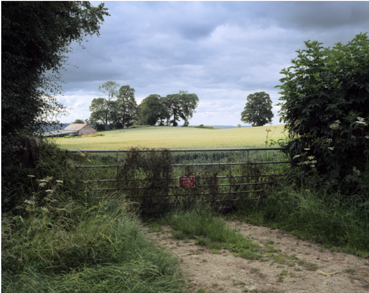
Hinterland, 2019, série English Encounters, tirage pigmentaire, 120 x150 cm

En 2022, il est lauréat du Prix Camera Clara avec la série English Encounters .