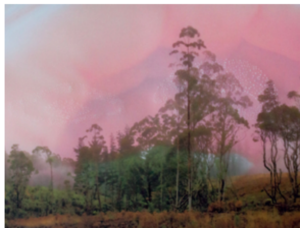
Fire)(scapes , 2021, impressions pigmentaires sur papier végétal et papier mat, gaufrage à la pointe sèche, 42 x 60 cm

À travers une approche sociologique, météorologique et philosophique, elle crée des objets photographiques en superposant des images d'archives retravaillées au gaufrage et en pyrogravure à des photographies de peau humaine. Intensifiés par des manipulations chromatiques, ces paysages évoquent la couleur des ciels de feu, rappelant notre rôle crucial dans la préservation de la nature et la nécessité d'engager un dialogue avec elle.